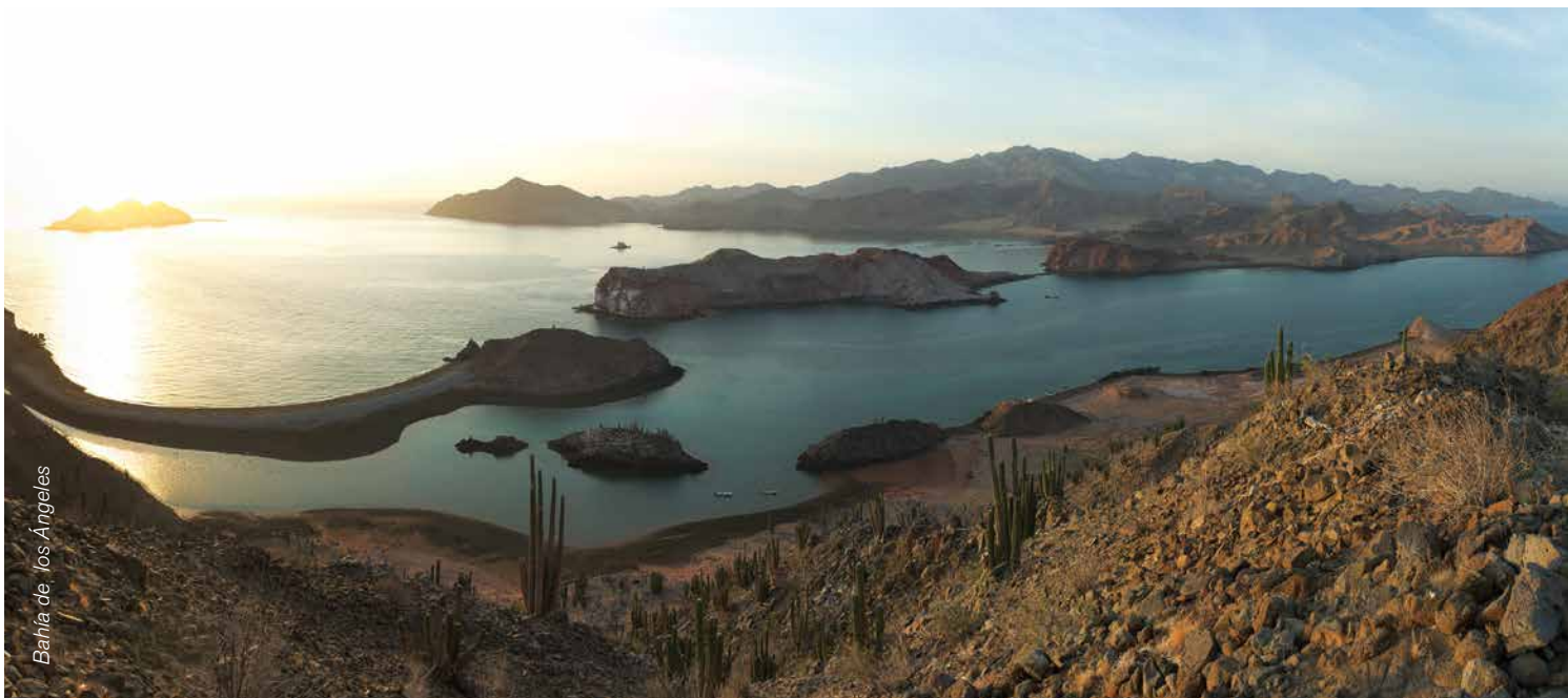
Bahía de los Ángeles

In Bahía de los Ángeles we implement applied fisheries research projects, natural resource management and conservation in a marine protected area of 380,000 hectares.