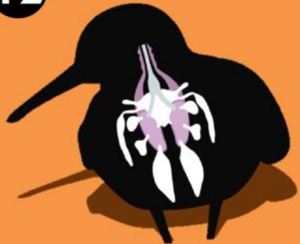
Bolsas de aire