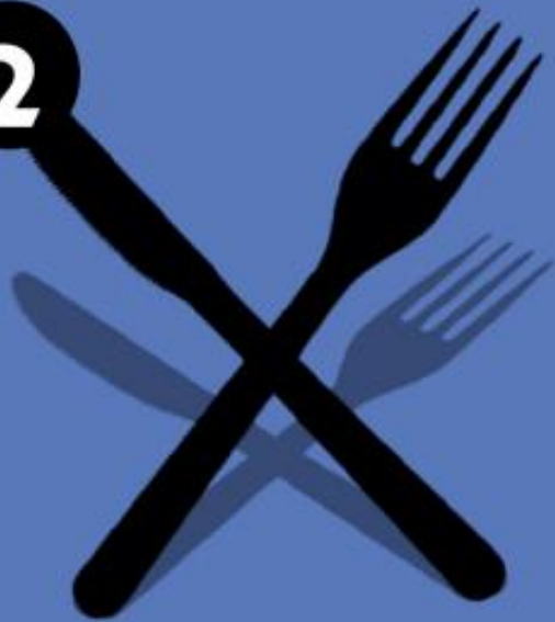
Zona de alimentación