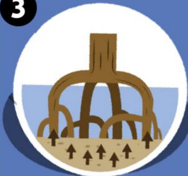
Absorción de nutrientes