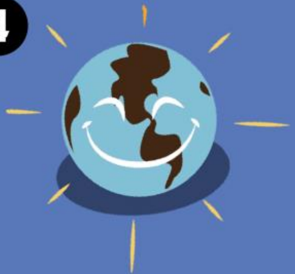
Mitigación del cambio climático