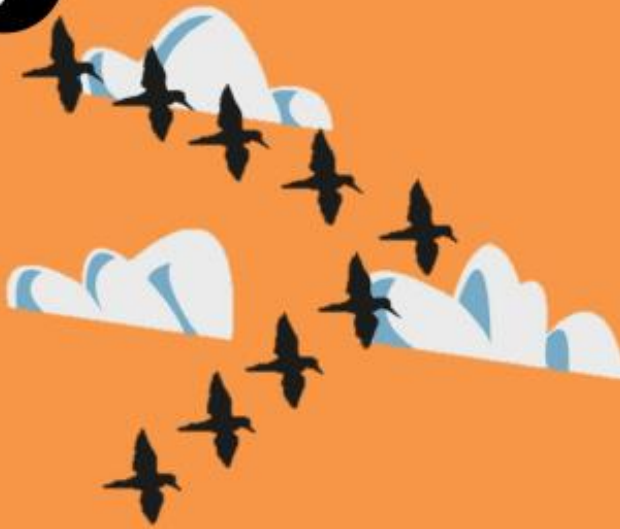
Vuelo en "V"